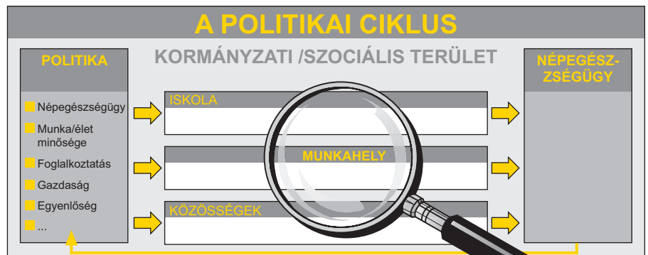
2. kép: A politikai ciklus különböző szinterei.